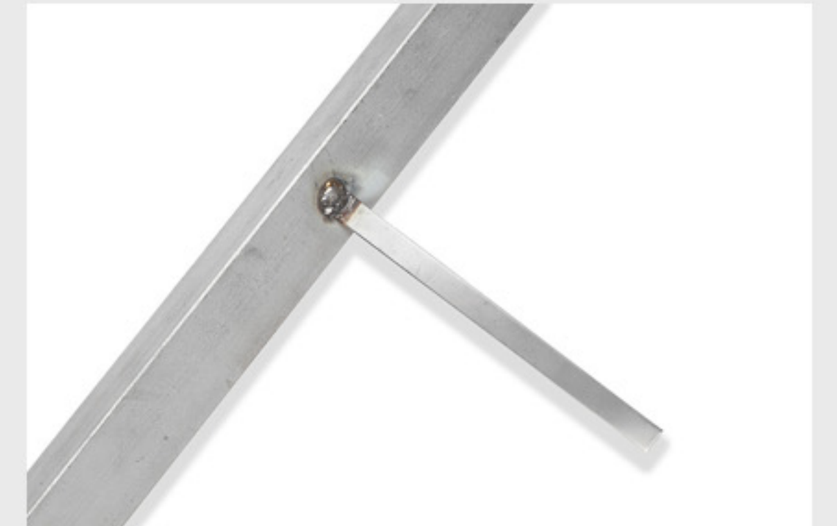
Pratzen angeschweißt Ansicht von unten