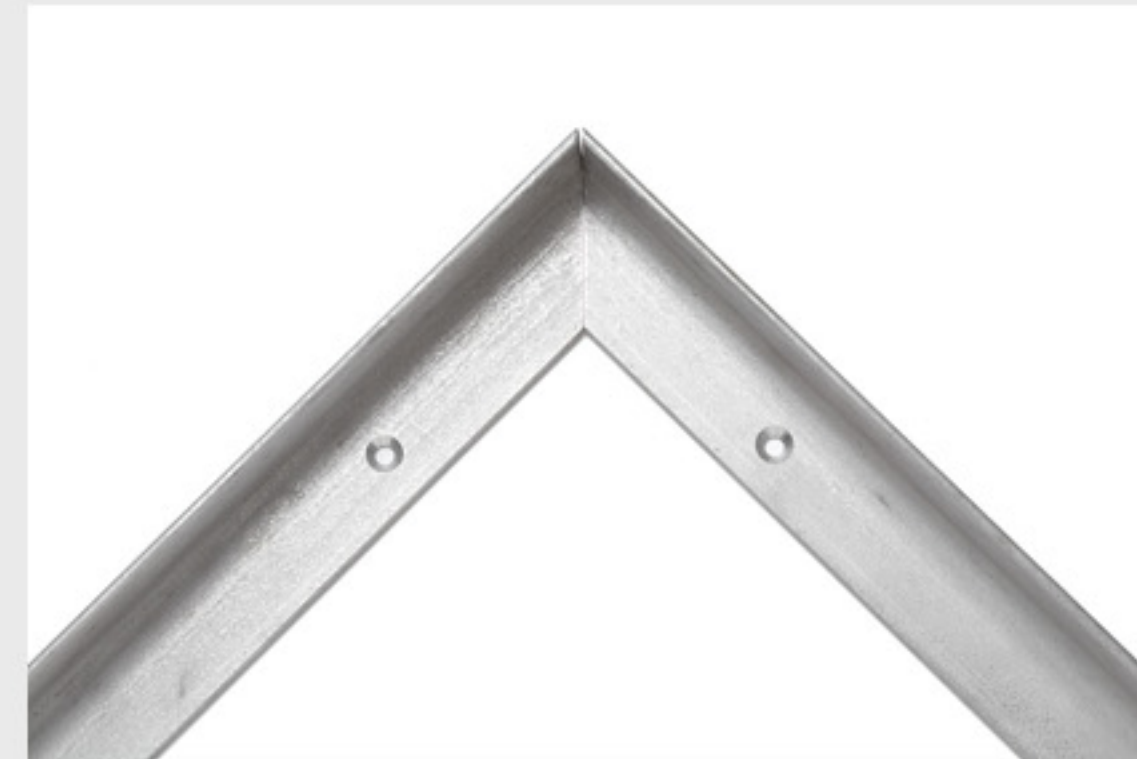
Loch gebohrt Ansicht von oben