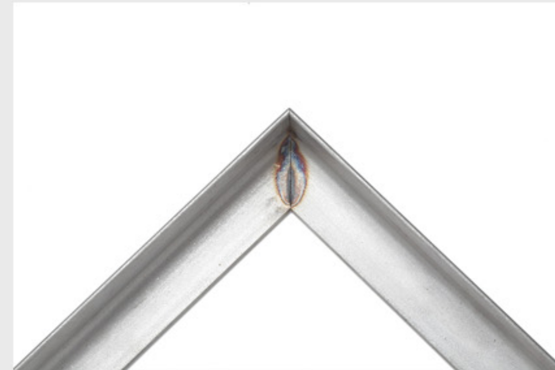
Ecke verschweißt Ansicht von oben