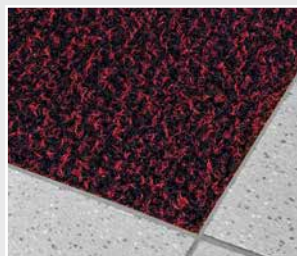
rot-meliert (auf Anfrage)

Versenkt: in SCHEYBAL Alu-Winkelrahmen AS 1/8 ab 2 m 2 vollflächige Verklebung empfohlen Frei aufliegend: mit SCHEYBAL Vinyl-Antrittprofil AN-P/4