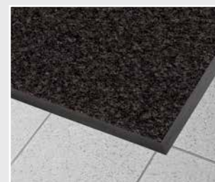
Texwell SUPER R8 freiliegend