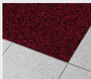
Texwell SUPER R8 versenkt