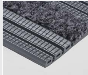
STEWELL TEX FLACH