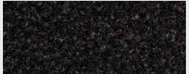
Texwell SUPER R9 anthrazit