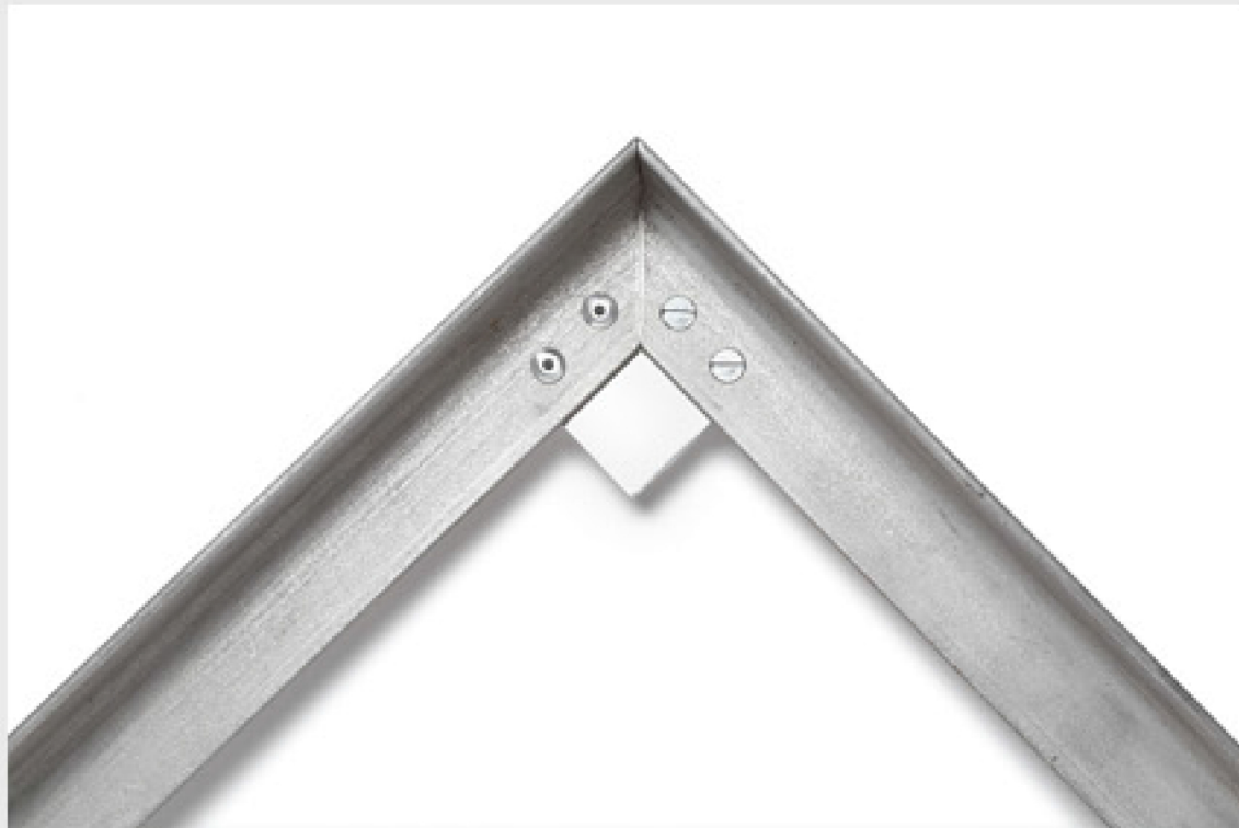
Ecke mit Aluplatte verschraubt Ansicht von oben